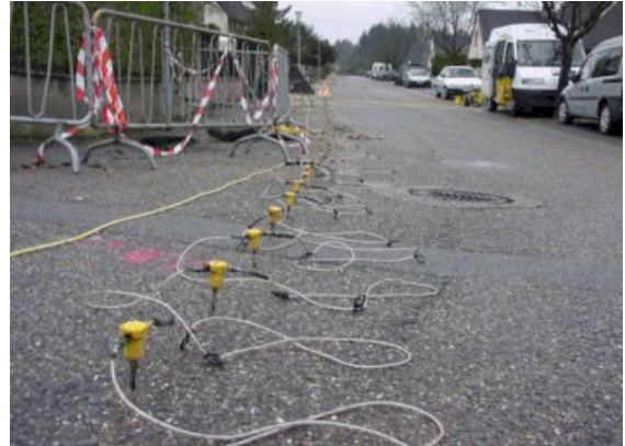
Illustrations : GEO2X

Le programme des travaux du 16 au 20 août est le suivant (si la météo le permet) avec des légères modifications possibles :